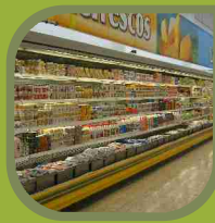
Lácteos y Refrescos