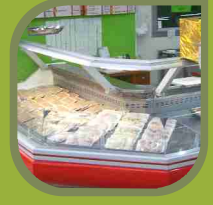
Carnes a Granel