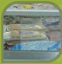
Pescados y Mariscos