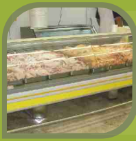
Pollos a Granel

Cra 39 No. 11-146 Parcelación Industrial Acopi