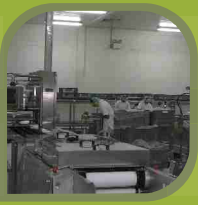
Salas de Proceso