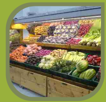
Frutas y Verduras