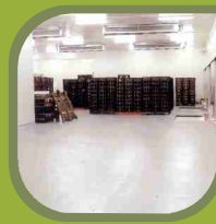
Muelle de Despacho Climatizado